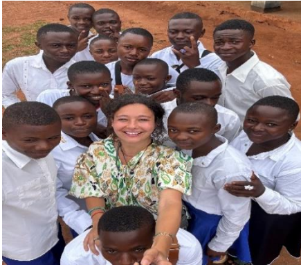
Figure 1: studenten van de Petits Champions