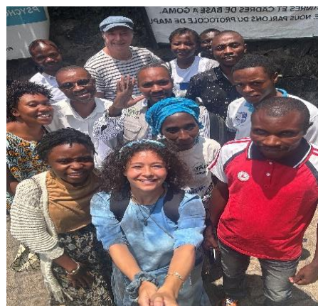
Figure 2: Centre d'IDAY

Het bezoek aan IDAY was erg aangenaam en interessant. We presenteerden ons ethisch handvest aan het team van IDAY en onze partner GHOVODI en leerden hen de waarden van ETM, waaronder integriteit en het feit dat je in een gezonde omgeving altijd integer moet handelen. We bespraken ook het externe evaluatierapport dat in juni werd uitgevoerd en de implementatie van de aanbevelingen voor kwaliteitsverbetering van het project. We hopen dat de voorgestelde aanbevelingen de kwaliteit van de trainingen in hotelmanagement, kinderopvang en koken zullen verbeteren. Een moeilijk moment voor ons was het bezoek aan een school in Goma, dat niet kon doorgaan vanwege de dood van een kind door een verdwaalde kogel afgevuurd door het leger. Het liet echt zien hoe gewelddadig en hard de situatie is in Congo.