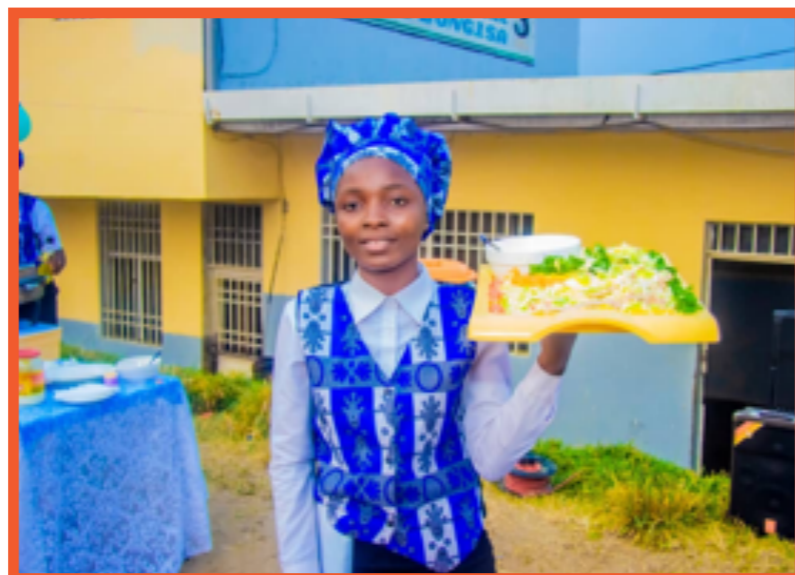
Ngaliema, Juli 2022: Examen voor de staatsjury.

De cursisten kunnen er ook terecht voor hun